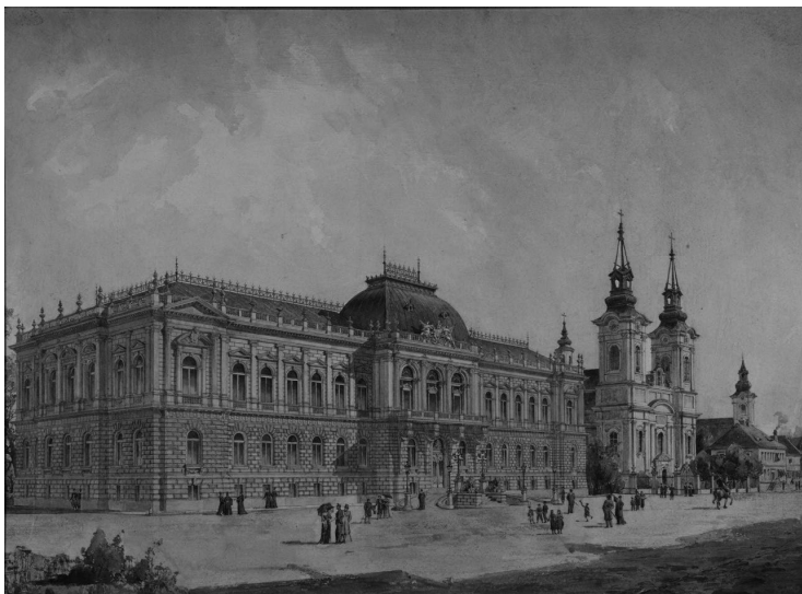
Патријаршијски двор, акварел, насликао Владимир Николић

менталне грађевине у центру, Николић је унео у њихову урбанистичку слику посебно обележје по коме свако са стране одмах може да закључи да Карловци нису неки провинцијски градић, него место у ком су се одигравали пресудни догађаји у животу једног народа.