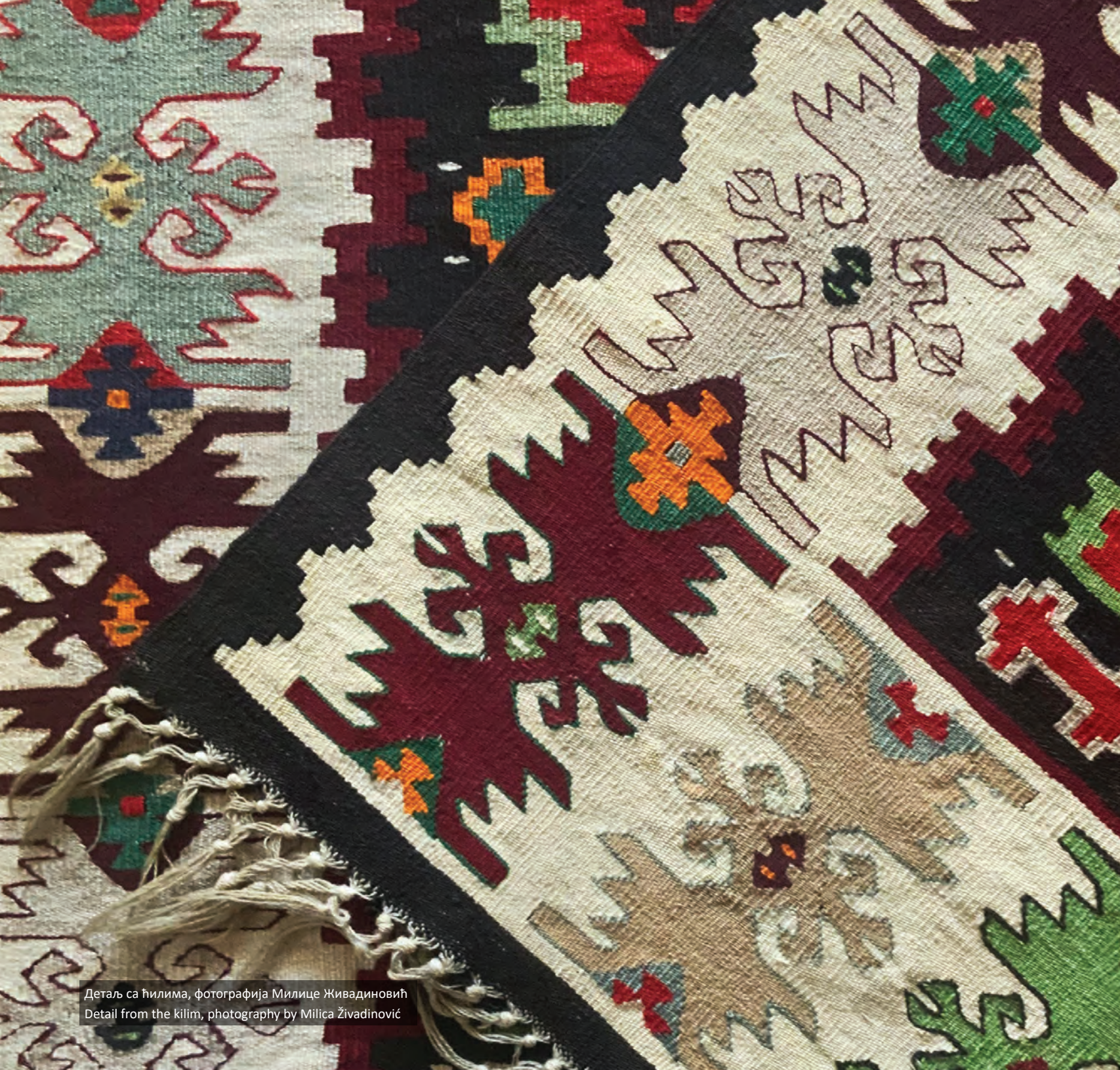
Детаљ са ћилима Detail from the kilim