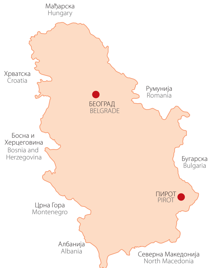
Карта Србије са ознаком Пирота Map of Serbia with a marker for Pirot