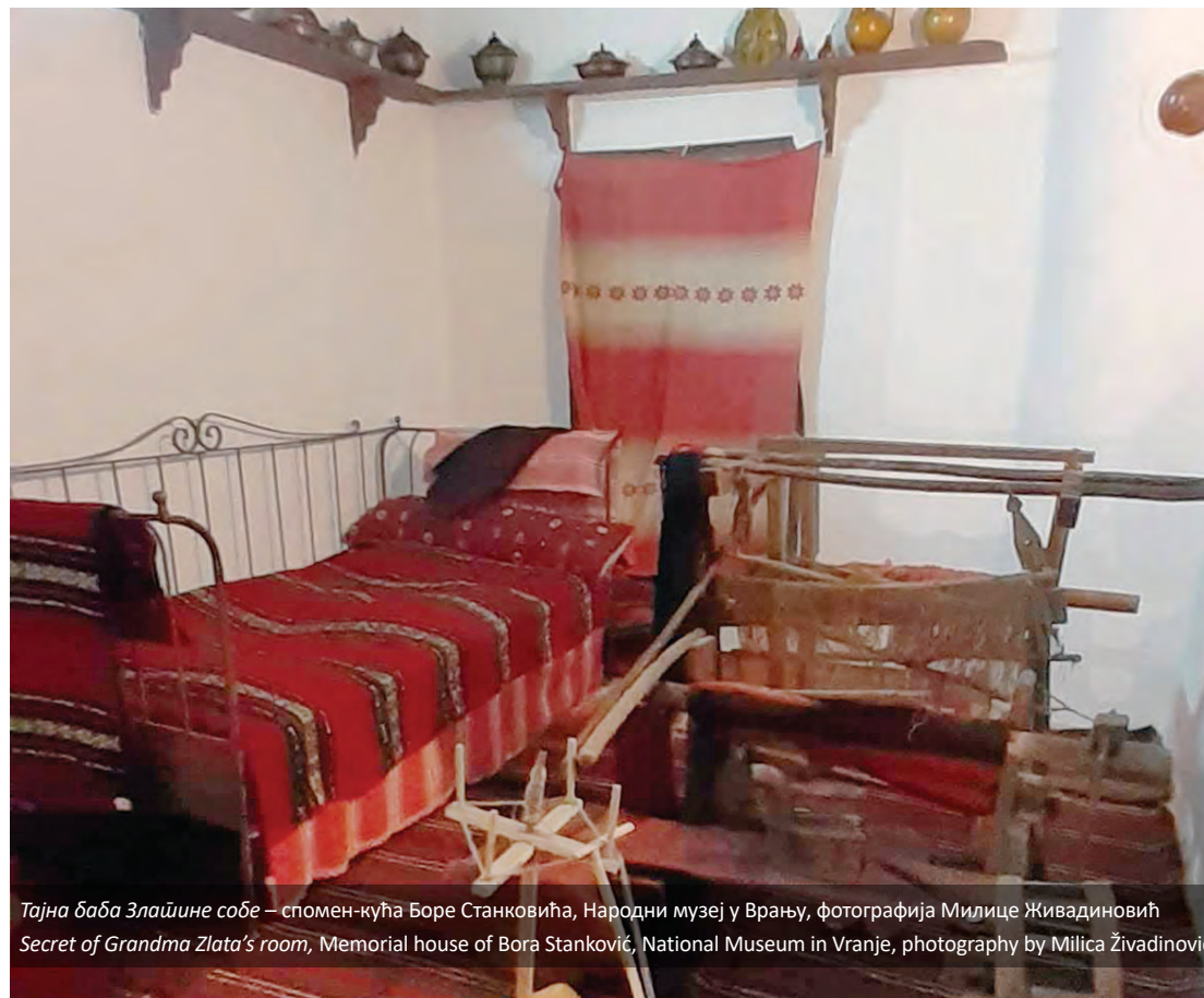
Тајна баба Злајшине собе – спомен-кућа Боре Станковића, Народни музеј у Врању, фотографија Милице Живадиновић Secret of Grandma Zlata's room, Memorial house of Bora Stanković, National Museum in Vranje, photography by Milica Živadinović