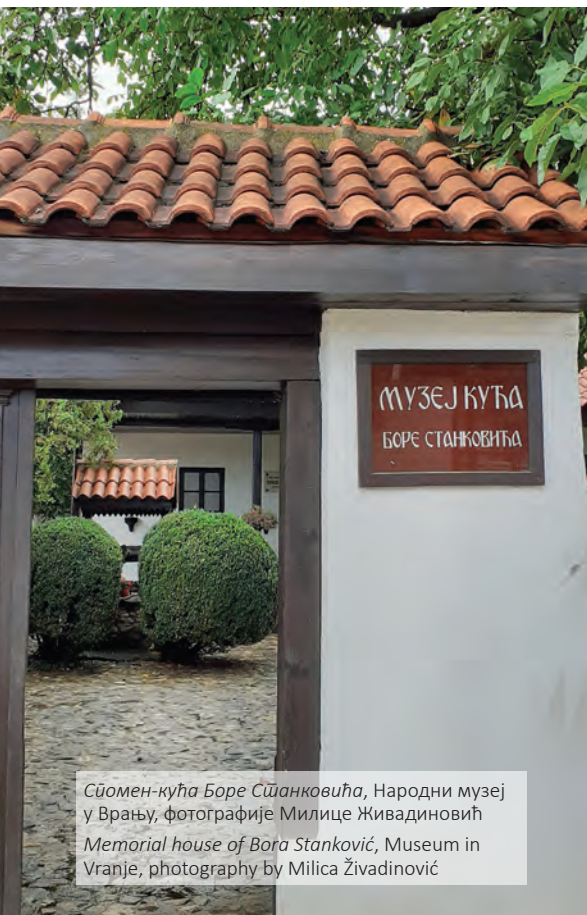
Сйомен-кућа Боре Сџанковића, Народни музеј у Врању, фотографије Милице Живадиновић Memorial house of Bora Stanković, Museum in Vranje, photography by Milica Živadinović