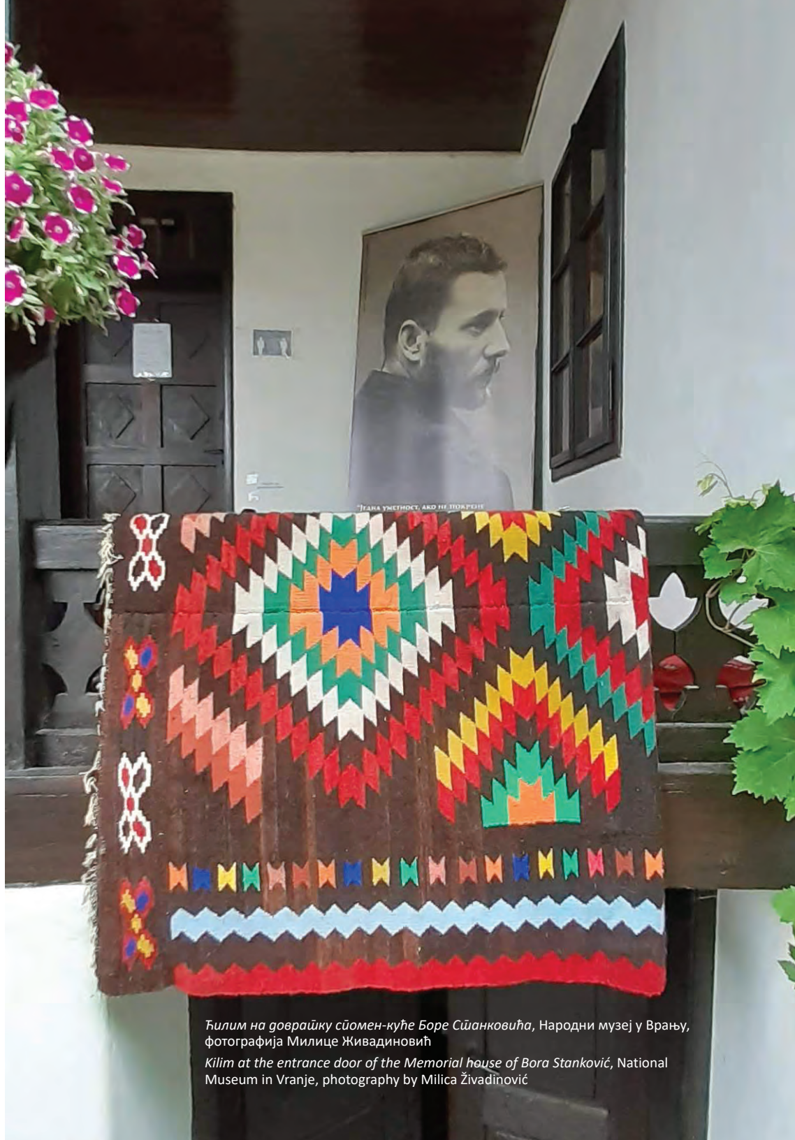
Ћилим на доврајку сјомен-куће Боре Станковића, Народни музеј у Врању

Kilim at the entrance door of the Memorial house of Bora Stanković, National Museum in Vranje