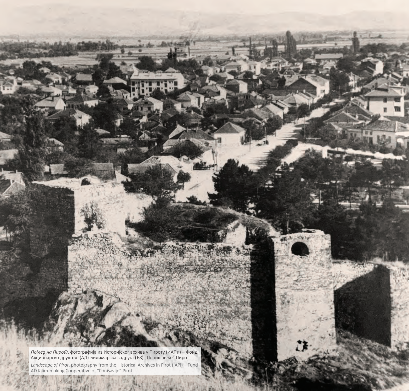
Појлед на Пироћ , фотографија из Историјског архива у Пироту (ИАПи) – Фонд Акционарско друштво (АД) Ђилимарска задруга (ЂЗ) „Понишавље“ Пирот Landscape of Pirot , photography from the Historical Archives in Pirot (IAPi) – Fund AD Kilim-making Cooperative of “Ponišavlje” Pirot