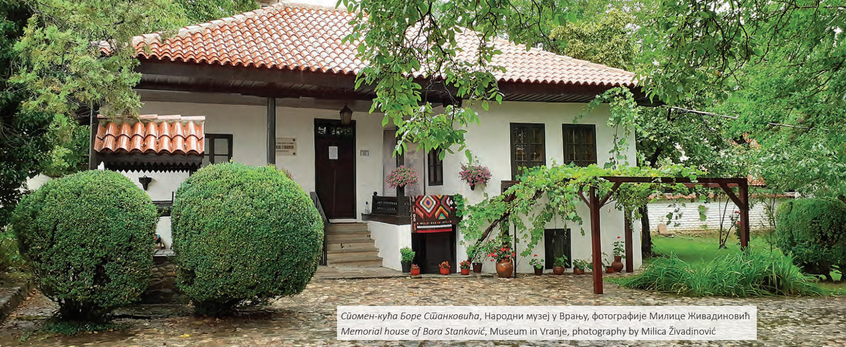
Сйомен-кућа Боре Сџанковића, Народни музеј у Врању, фотографије Милице Живадиновић Memorial house of Bora Stanković, Museum in Vranje, photography by Milica Živadinović