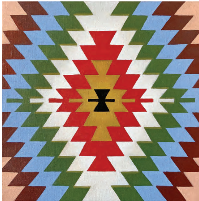
Милица Живадиновић, Софра , 2019, уље на платну, 30×30 цм Milica Živadinović, Sofra , 2019, oil on canvas, 30×30 cm

This book embodies my desire to present this part of the cultural heritage of Serbia, rich in colors and hues, original in form, but also full of hidden symbolism. The universe of Pirot kilims allows readers to realize that patterns are centuries-old symbols and that each kilim is brimming with authentic feelings and energy.