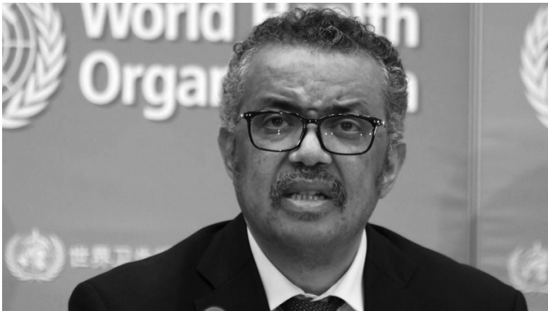
Шеф Светске здравствене организације Тедрос Аданом Гебрејезус.

Шеф Светске здравствене организације Тедрос Аданом Гебрејезус изјавио је да је здравствена ситуација са епидемијом вируса корона можда најтежа коју је до данас та организација прогласила. Генерални директор СЗО рекао је на конференцији за новинаре у Женеви, 27. јула 2020.