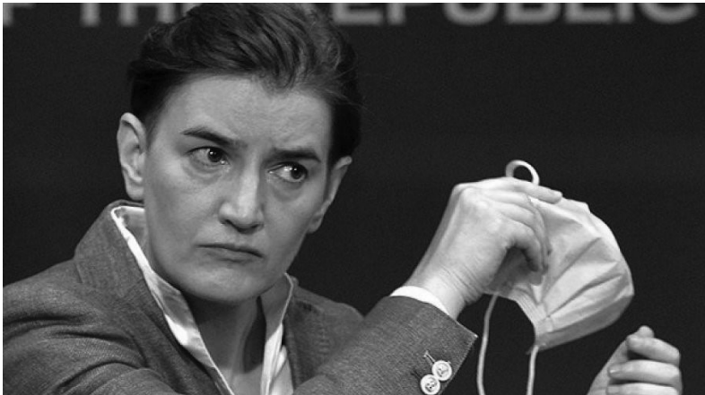
Ана Брнабић, Председница Владе Републике Србије.

и априлу, било увођење ванредног стања и забрана кретања макар викендима, да би се прекинуо овај раст бројева и да би се омогућио простор за дисање нашем здравственом систему, јер ова борба ће трајати дуго – навела је Брнабић.