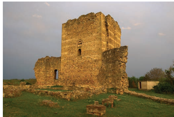
Тодорова кула, Сталаћ

Од приближно двеста средњовековних утврђења, колико помињу историјски извори, могуће је идентификовати тек педесетак. У мањој или већој мери су очувана, а понека су доступна само добро припремљеним планинарима.