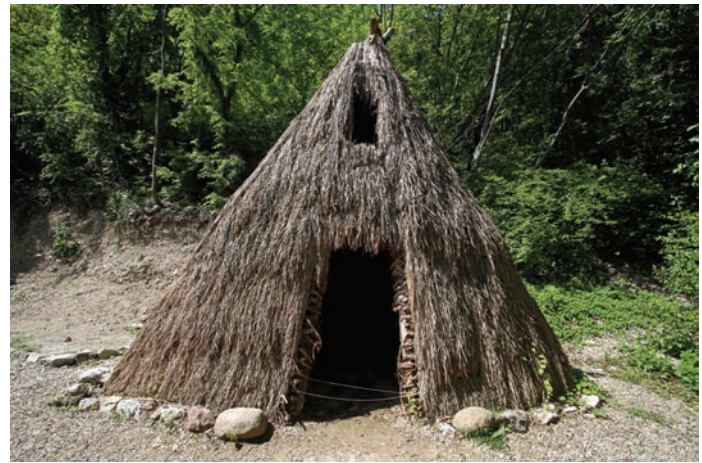
Лепенски вир, кућа

плодова, лов и риболов, сматра се да су у последњој фази покушали да гаје биљке и припитомљавају животиње, што је довело до стварања земљорадничко-сточарских заједница. Због изолованости Ђердапске клисуре и здраве исхране припадници Лепенске цивилизације били су здрави, релативно дуговечни и нису знали за ратове. Бројне фигурине рибликих бића указују на развој уметности и религије.