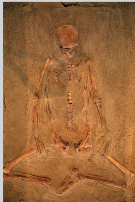
Лепенски вир, скелет