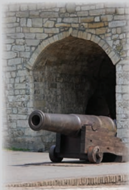
Калемегдан и Деспотова кула