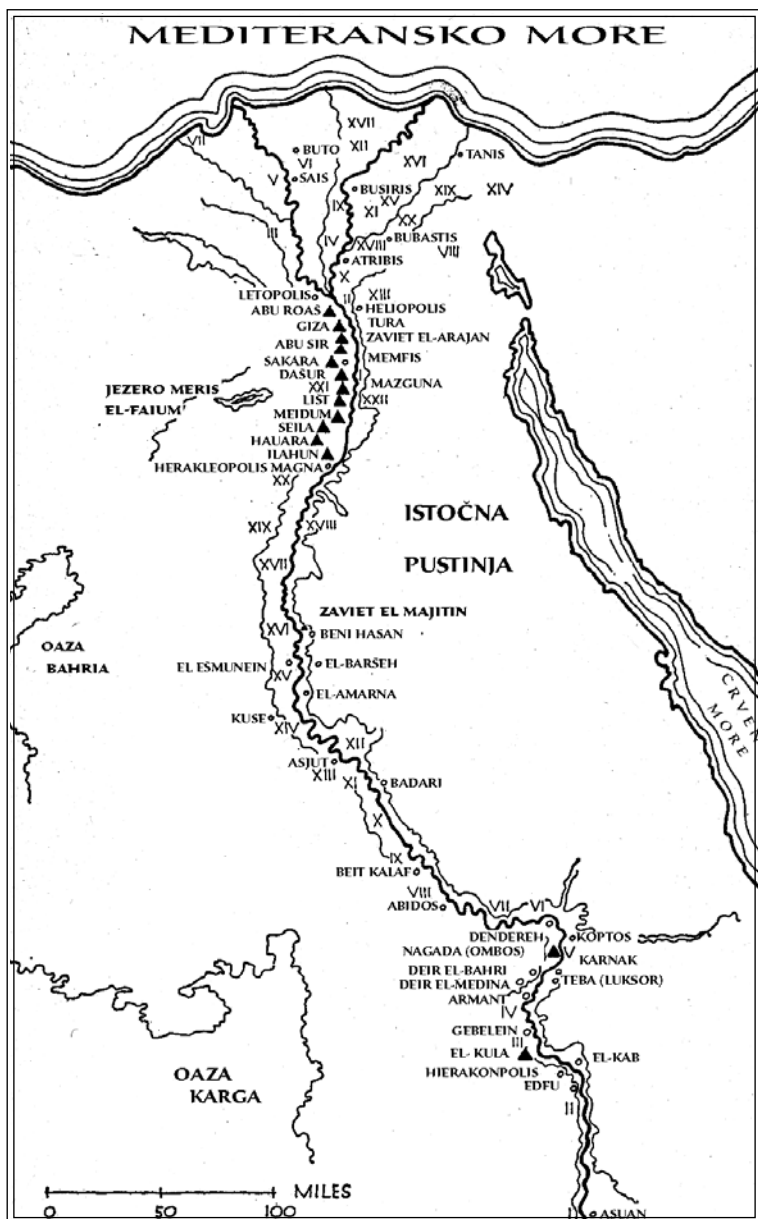
Crtež 1: Mapa Egipta