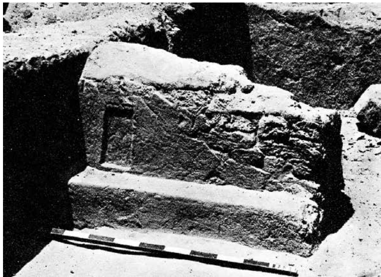
Pomoćna mastaba od cigala iz I dinastije

Jedva da imamo bilo kakvo detaljnije znanje o metodama političkog upravljanja koje su sprovodili Menes i njegovi neposredni naslednici, ali izgleda jasno da su uveli veliki stepen centralizacije. Iskopavanja W. B. Emeryja u Sakari, u nekropolisu Memfisa, iznela su na videlo dana grupu velikih, ali surovo opljačkanih grobnica koje datiraju iz I dinastije, od kojih su neke