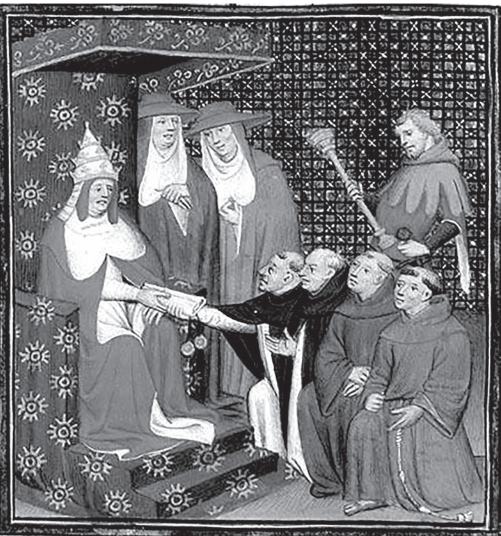
1. Papa Inoćentije IV šalje dominikance i franjevce među Tatаре, majstor knjige Grad žena