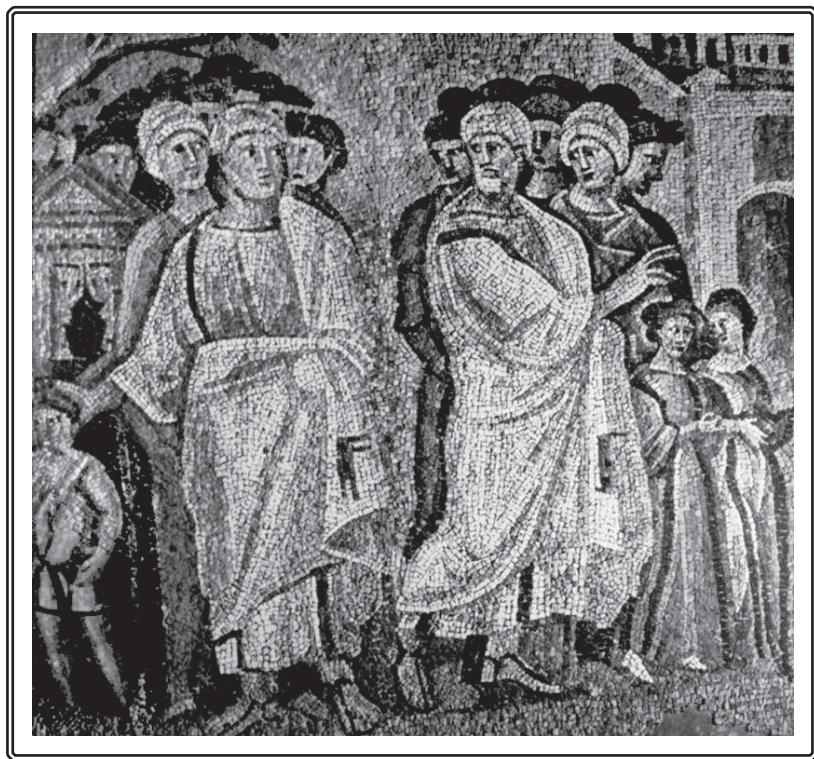
3. Postanje, 13. mozaik u crkvi Santa Marija Madore u Rimu