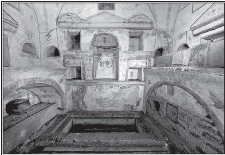
5. Grobnica iz 2. veka, otkrivena u skorijim otkopavanjima ispod Bazilike Svetog Petra u Rimu, gde je, po predanju, Sveti Petar bio sahranjen

Svetog Pavla na Ostijskom putu, autentičan ili ne, nema sumnje da je ta telesna bliskost s Petrom bila prednost koju je rimski biskup mogao da eksploatiše ako bi se ukazala potreba za tim. Upravo se to i desilo tokom trećeg veka kada su pitanja, kao što su slavljenje Uskrsa i oprost grehova, vodila do žestokih doktrinarnih kontroverzi. Argumenti koje su Irinej i Tertulijan nekad upotrebljavali protiv sekta, sada su bili okrenuti ka drugim crkvama.