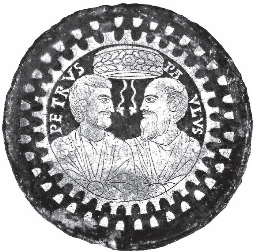
4. Apostoli Sveti Petar i Sveti Pavle navode se u ranoj tradiciji kao zajednički osnivači rimske crkve.