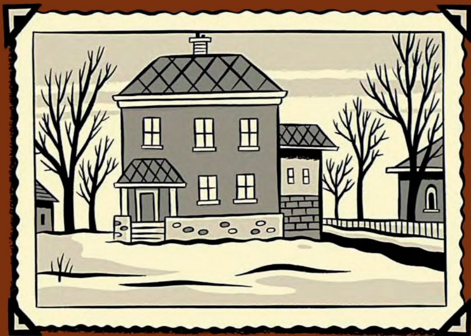
Dom – 1960