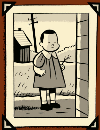
~ 1962 ~