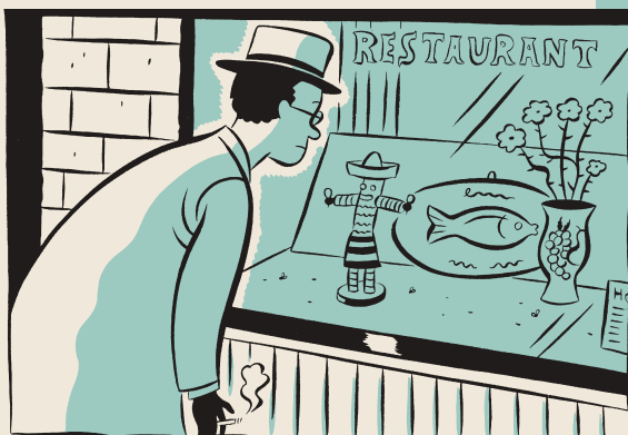
Nostalgija plave boje

tema kojima se počeo baviti u Palukavilu , no čini mi se kako bi to bio pogrešan put. Naposljetku, zadaća predgovora nije tumačiti djelo već ga otvoriti. Pokušajmo, dakle, zaobilaznim putem otvoriti ovaj strip.