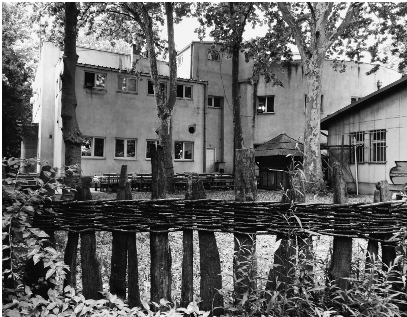
Slika 1: Restoran na mestu logora smrti na Starom sajmištu, Beograd

jalo je objašnjenje da je slika „primer životnih uslova zatvorenika na Golom otoku“. 13