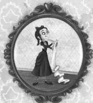
пицца петпарачких прича