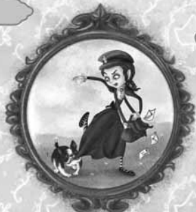
ћерке управника поште