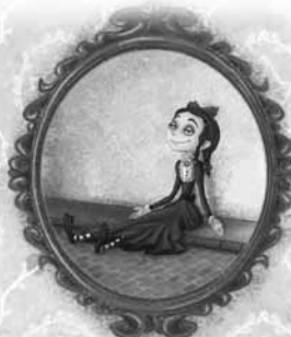
краве на седативима