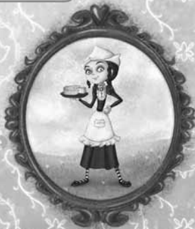
нећакe произвођача сира