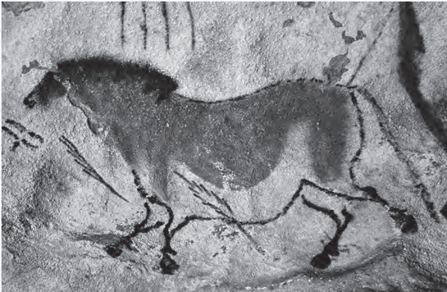
Pećinska slika, Lasko, oko 15.000 p. n. e.

grančicama, mahovinom ili četkama od krzna. Mnoge slike životinja su kopirane s mrtvih modela. Naturalistički pristup, često prikazivanje životinja probodenih strelama ili kopljima, nehajno preklapanje crteža i njihov položaj u najnedostupnijim delovima pećine sugerišu da je stvaranje tih slika bilo magijski obred kojim će se obezbediti uspeh u lovu.