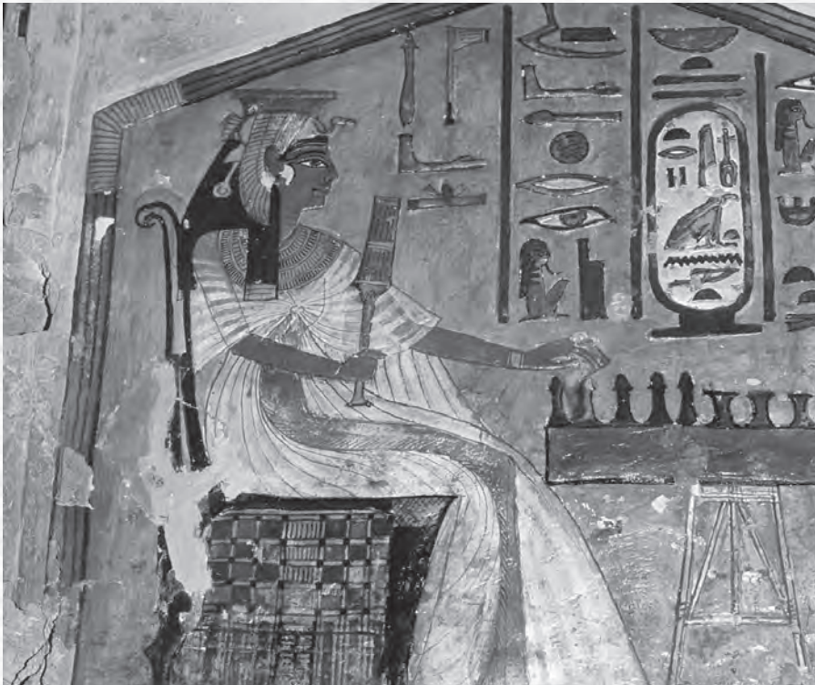
„Kraljica igra šah“, Nefertarina grobnica, Teba, oko 1255. p. n. e.

trup i oči su prikazani spređa, a glava, ruke i noga sa strane. Figure igre takođe se vide sa strane, u svom najprepoznatljivijem obliku. Hijeroglifi u okviru slike nude bajalicu namenjenu da preobrazi Nefertari u pticu, čime će joj pomoći da napusti ovozemaljsko telo i započne zagrobni život kao besmrtnica.