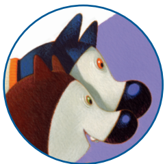
Мама и тата Плавић