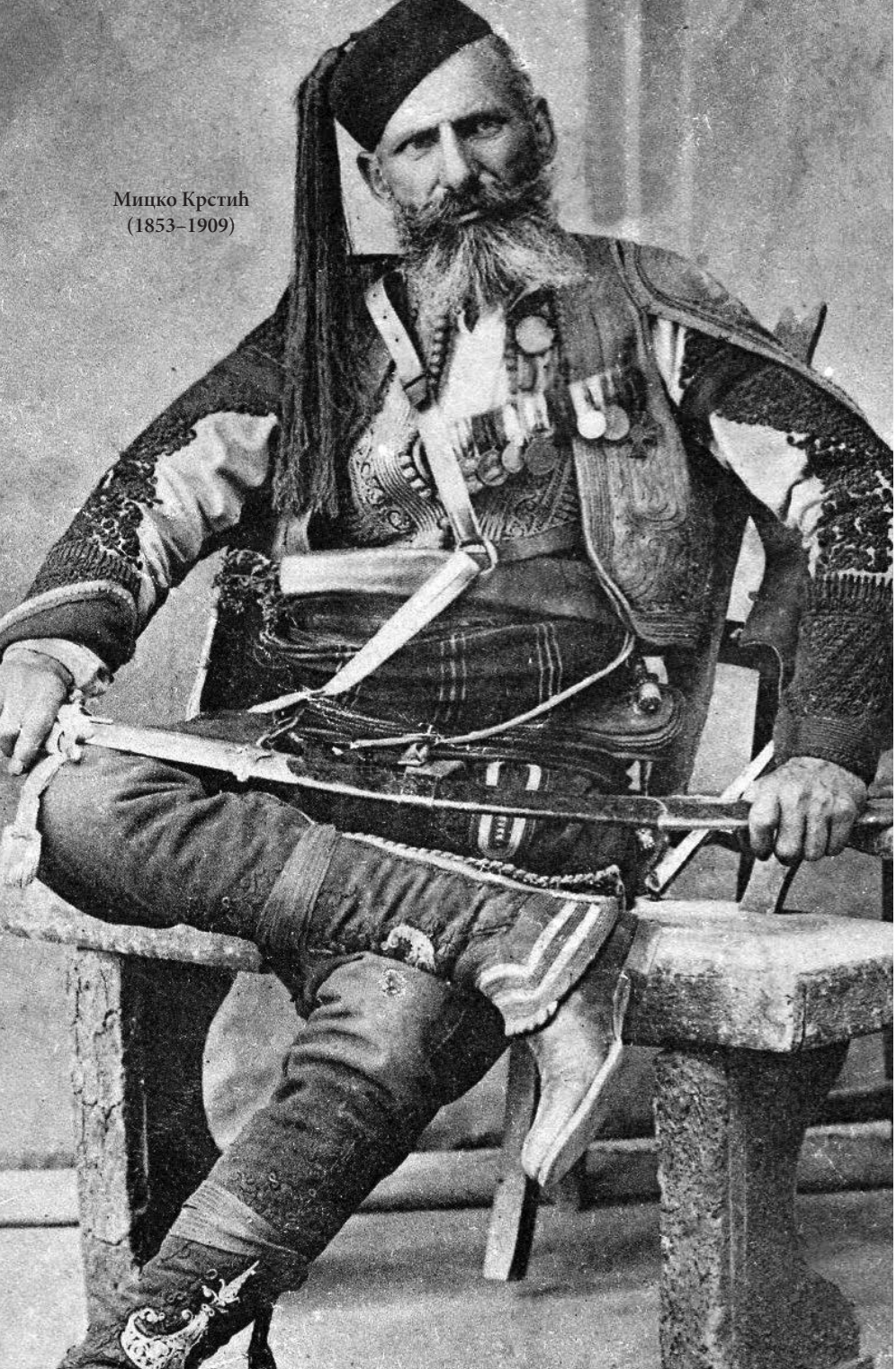
Мишко Крстић (1853–1909)