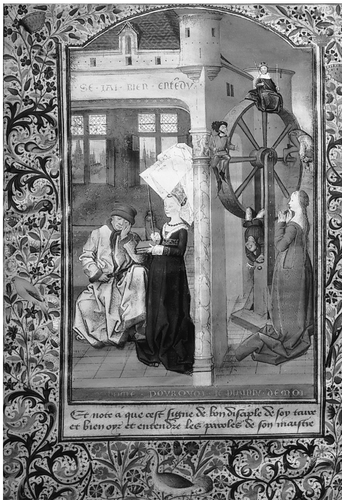
1. Na ovoj renesansnoj slici Boetije (oko 480–525. godine nove ere) je prikazan kako sluša reči Filozofije, koja je predstavljena kao dama. Uteha Filozofije njegova je najpoznatija knjiga, a upravo mu je uteha bila potrebna dok je čekao pogubljenje. No, filozofija je imala i mnoge druge svrhe pored ove.