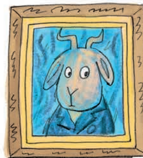
Јарац ван Гог