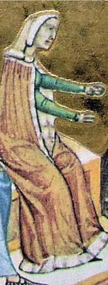
Јелена Вукановић, деишаљ Мађарске илустроване хронике, XIV век

да Србе држи у каквом-таквом миру, имајући у виду да је у та времена имао и много озбиљније проблеме на другим странама. Таоце је цар одвео у Цариград, где их је показао светини, као доказ свога успеха у ратовима на Балкану.