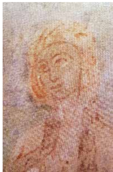
Марија Вукановић Пшемисл, геџаљ фреске, XII век

Три сина Уроша I су постали велики жупани након њега (Урош II, Деса и Белош), један син је достигао највише положаје у суседној Угарској (палатин и бан Белош), док су две кћерке биле удате за угарског краља (Јелена) и моравског војводу (Марија). Колики је био утицај блиских суседских односа са Угарском по Србе речито говори и Хиландарска њовеља Стефана Немање из 1198. године у чијем уводу се каже да: Бој њремилосџиви уџврди Грке царевима, а Уџре краљевима, а Немањиним прецима дарова да владају овом земљом срџском, као велики жупани.