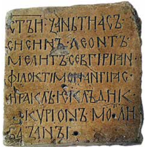
Темнићки натпис, најстарији ћирилични натпис и сѡоменик сѡарословенске ѡисменосѡи на Балканском ѡлоуосѡрву, крај X или ѡочешак XI века – археолошка збирка Народноѡ музеја у Беоѡрагу

Цар је наредне 1094. године, по трећи пут узастопно дошао на српску границу код Липљана. Но Вукан је поново применио исту тактику. Ана Комнина каже да је био вешѡи на речи и вешѡи на делу . Дошао је у царев табор, праћен сродницима и угледним жупанима, склопио је мир и дао двадесет талаца (као обезбеђење да ће поштовати обавезе), међу којима и два синовца, Уроша и Стефана Вукана. Велики жупан је тако избегавао да уђе у директну борбу са војском самога цара, која је без сумње била бројнија и снажнија него раније војске које су стизале из Византије. Са друге стране, Алексијева тактика показује да је он у суштини био задовољан