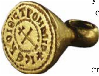
Печат кнеза Сиројимира, из грује половине IX века, представља најстарији материјални доказ о постојању српске државе на Балканском полуострву

У повељи Стефана Немање манастиру Хиландару говори се о томе како је велики жупан Немања обновио и уздигао своју њалу дедовину и набрајају се области и земље које је ујединио са Рашком.