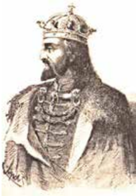
Цар Константин Бодин је био српски краљ од 1081. до 1099. године и њрви Србин крунисан за цара 1072. године

У прво време, ратове против Византинаца је предводио дукљански краљ Бодин, али кад су Византинци успели да га заробе, борбу је преузео Вукан. За Вукана, оног човека који је држао сву власт у Далмацији (тј. у Србији – А. Комнина), Ромеји су говорили да је страشان, а о његовим нападима писали су са грозом. Цар Алексије је због српских побуна три пута лично долазио на границу са Рашком.