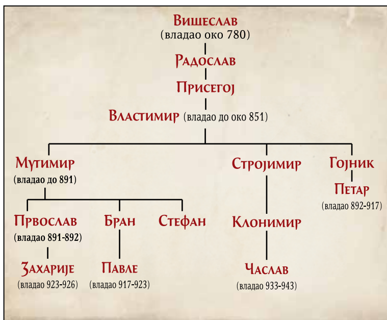
Срџска динаџија Вишеславићи