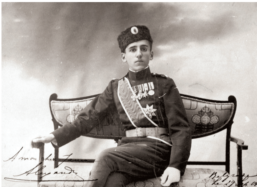
Краљевић Александар као пешадијски каплар, јун 1904.