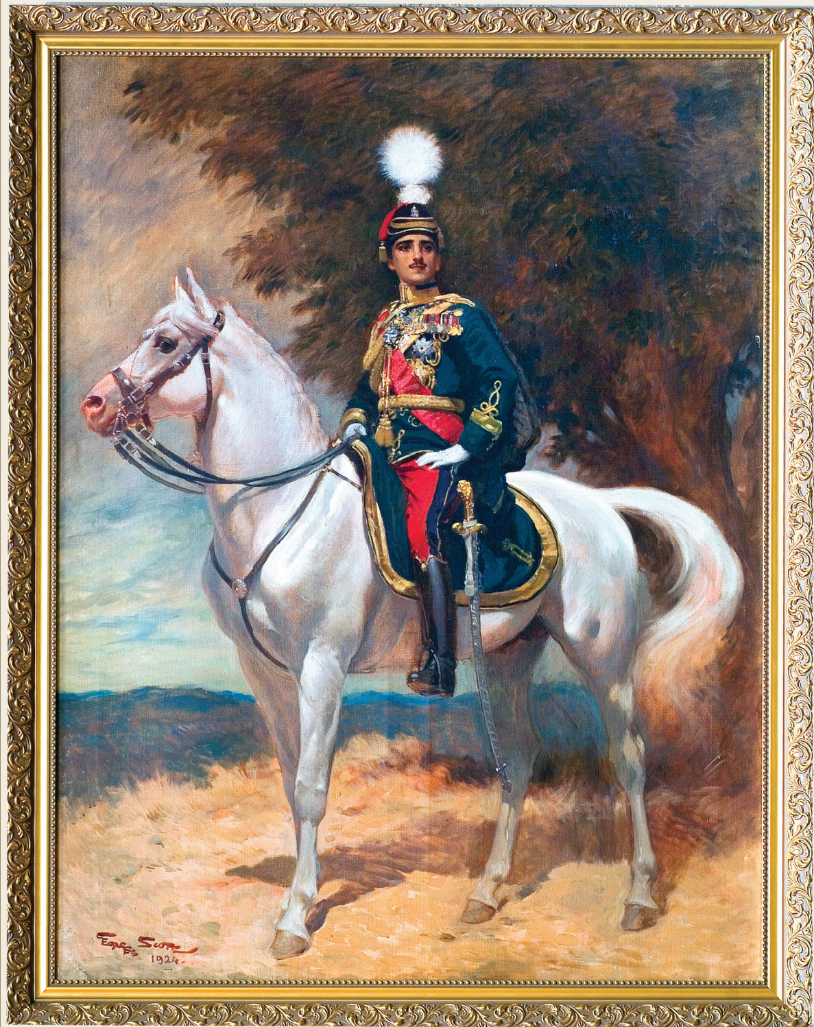
Жорж Берџен Скоџи, Краљ Александар Карађорђевић на коњу у свечаној униформи пуковника коњице Краљеве гарде, 1924, уље на џлајну (збирка Дворској комплекс на Дедињу)