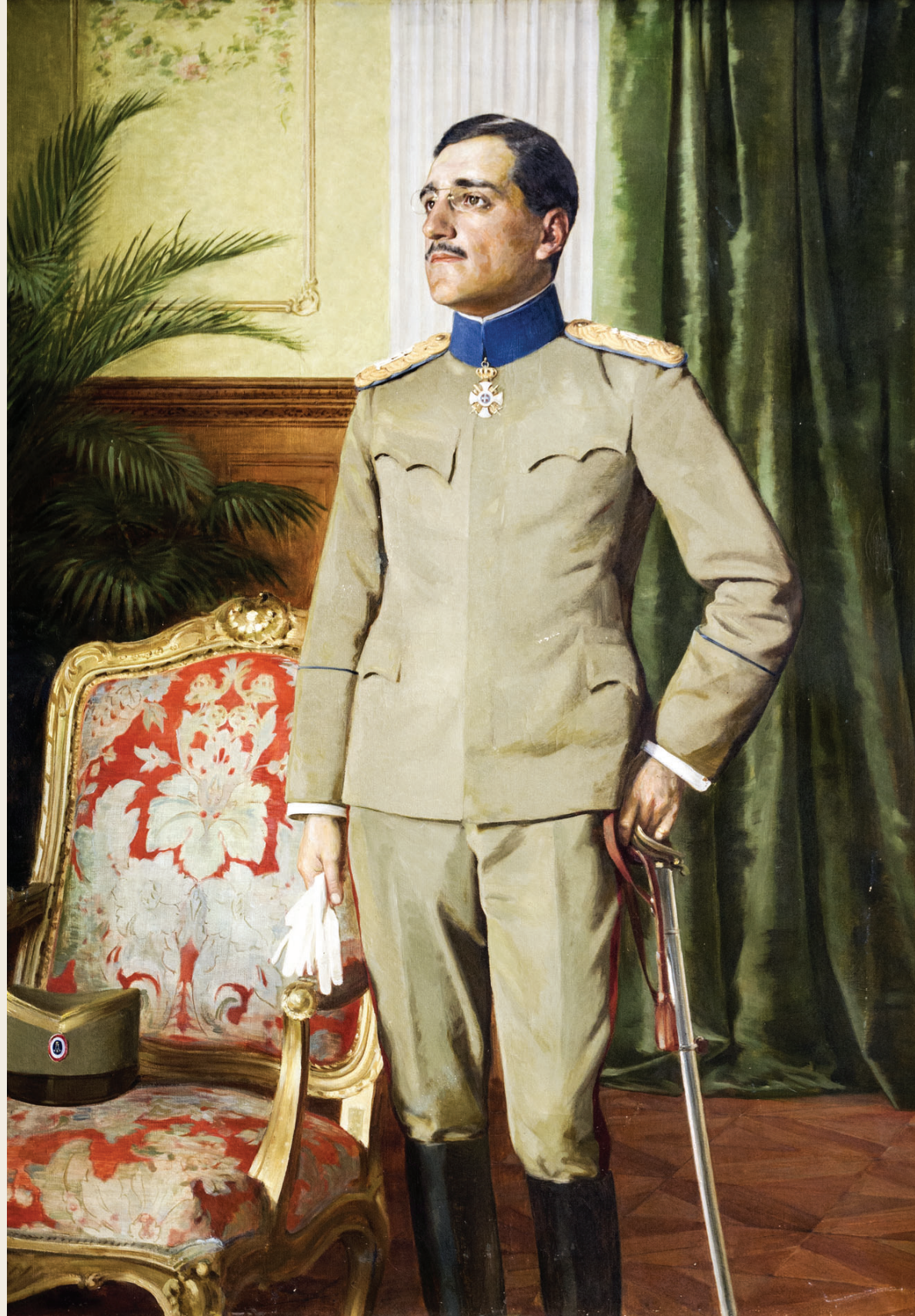
Урош Предић, Краљ Александар Карађорђевић у генералској униформи, 1922, уље на илајну (Народни музеј Зрењанин, НМЗР ЗЛУ 236).