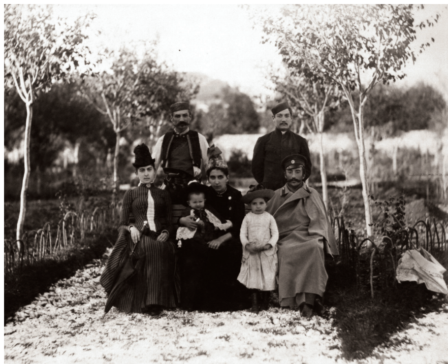
Кнежеви Пејтар, Арсен и Ђорђе Карађорђевић, кнегиња Зорка са децом Јеленом и Ђорђем, Цетиње, 1887.

Оба сина кнеза Петра Карађорђевића, будућег краља Србије, школовала су се у војним школама у Санкт Петербургу. Старији Ђорђе (1887–1972) од