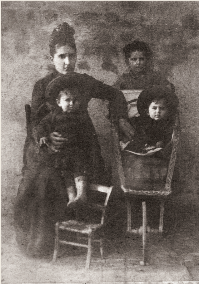
Кнегиња Зорка са децом, Цетиње