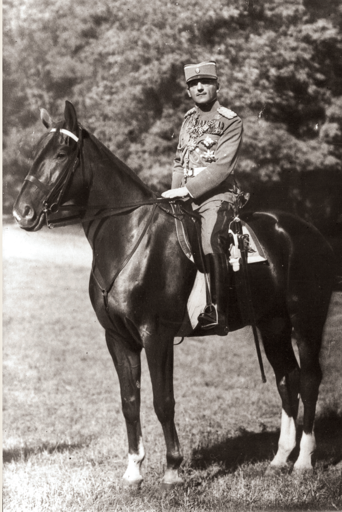
Краљ Александар на коњу, око 1930.