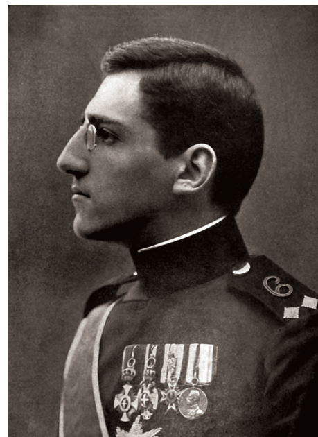
Краљевић Александар као пешадијски поднаредник, јун 1905.

У току службе у војсци, млади краљевић, као подофицир српске војске (у чин каплара је унапређен 10. јуна 1904. године, у чин пешадијског поднаредника 10. јуна 1905. године, а у чин пешадијског наредника 10. јуна 1907. године), у јесен 1905. упућен је поново у Санкт Петербург да настави школовање. Примљен је у елитни Пажевски корпус 2 , а пре него што се јавио у школу, лично га је примио цар Николај II. 3