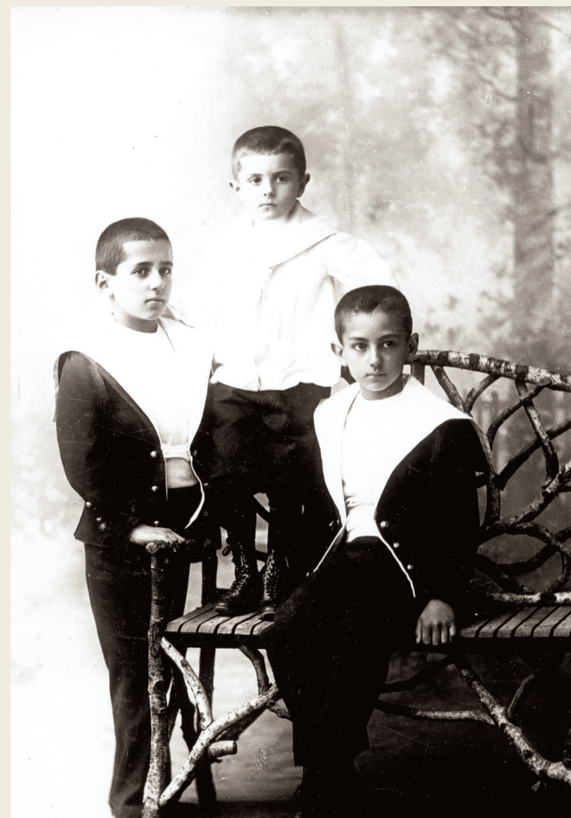
Кнежевићи Александар, Ђорђе и Павле и кнегиња Јелена, Женева, око 1895.