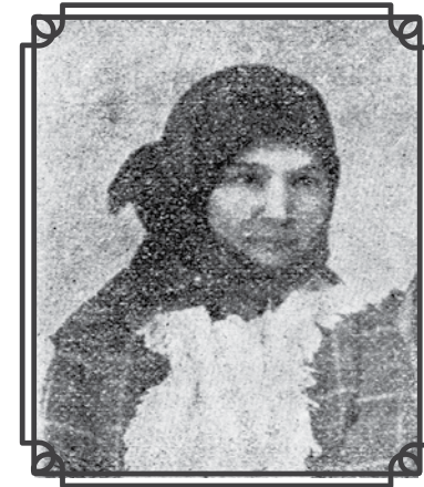
Rodom iz Beograda. U dobu učinjenog zločina imala je 23 godine.