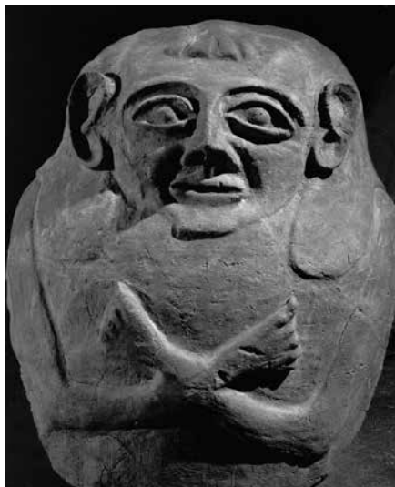
1. Filistejski pogrebni kovčeg. Kovčeg iz filistejskog groblja u mestu Deir el-Balah koji je bio načinjen u pseudoegipatskom stilu.

kultura, najvećim delom, bila pozajmljena. Filistejska grnčarija pripada mikenskom stilu. Njihov jezik uskoro je potisnuo jedan od hananskih dijalekata. Čak je i njihov neuspešni napad na Egipat imao određene posledice po kulturu i običaje. Svoje pokojnike sahranjivali su u kovčege ukrašavane na način da su podsećali na egipatske sarkofage s poklopcem izrađenim od pečene zemlje, koji su na vrhu imali prikaze lica i disproporcionalnih ruku, prekratke da bi se obuhvatile. Takvi pseudoegipatski kovčezi sadržali su čak i hijeroglifike koje je očigledno naslikao neko ko ih je video, ali nije poznao njihovo značenje. Značenje hijeroglifa bilo je bez ikakvog smisla.