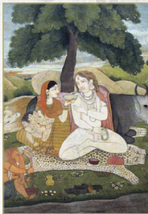
Prikaz iz hinduističke mitologije

Ovaj put oko sveta mitologije omogućice nam da uporedimo razne mitove koji postoje diljem sveta, veoma nalik jedne drugima u pokušaju da objasne kosmos, ali konkretno iskazane na vrlo različite načine. Mitologija je deo zajedničkih tekovina čovečanstva, nalazi se u korenima umetnosti i istorije, te je i dan-danas sastavni deo onog kolektivnog nesvesnog o kome je govorio Jung.