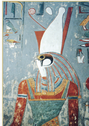
Egipatski bog Horus

Međutim, mit takođe sadrži i pojašnjenje. Mitologija se ne pojavljuje kao puka zbirka priča o herojima, po ugledu na sred-njovekovne viteške romane. Taj uređeni skup mitova koji nazivamo mitologijom nastoji da oblikuje jedan pogled na svet, da postavi koordinatne ose u čiji će sklop