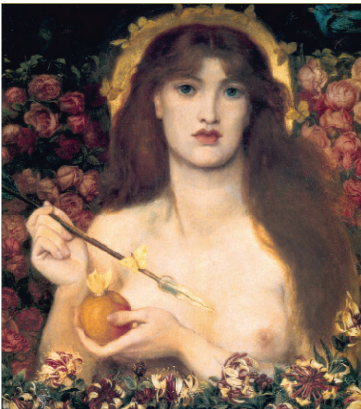
DANTE GABRIJEL ROSETI: Venera Vertikordija

Rimska mitologija je , sa svoje strane, verna replika legendi klasične Grčke : prosto-naprostu su izmenjena imena nekih bogova, kao Hera u Junona, ili Afrodita u Venera. Pripovesti su ostale istovetne. Ipak, postojala su i neka izvorno rimska božanstva, kao Bona Dea (Dobra boginja) ili blizanci Romul i Rem, pored bogova pokorenih naroda, postepeno uvršćenih u rimski panteon.