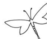
18 vilinih konjica