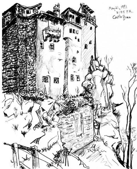
Zamak Bran u Braşovu – sada lažni „Drakulin zamak“ za turiste.

U drugom delu našeg putovanja, posetili smo grad Brašov, podignut u Vladovo doba, gde se zamak koji nije imao nikakve važnosti u životu Vlada Cepeša i njegovoj krvavoj karijeri danas slavi kao „Drakulin zamak“ i gde se dovode turisti koje zanima Drakula. Zamak Bran izgleda