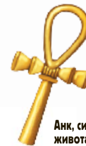
Анк, симбол живота

Прва фараонка била је Хатшепсут, ћерка Тутмоса I, одгајана да га наследи. Била је најмоћнија владарка у историји, моћнија чак и од чувене Клеопатре.