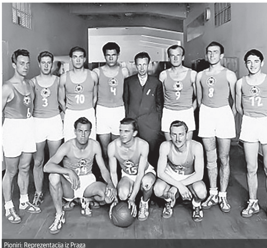
Pioniri: Reprezentacija iz Praga