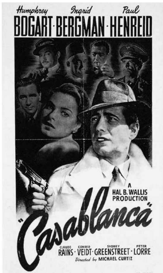
61 Reklamni plakat za film Kazablanka (1942) Majkla Kertisa: Hamfri Bograt i Ingrid Bergman u ulogama Rika i Ilse Lund, koje su odbili Ronald Regan (Ronald Reagan) i En Šeridan (Ann Sheridan).

Hauard Hoks (1896–1979), reditelj eklektičnog stila, koji je radio za nekoliko filmskih studija nezavisno od studijskog sistema, snimio je neosporne klasike koji se bave svim glavnim tipično američkim temama. Imao je dara za pripovadanje, a najveći talenat ispoljio je u skrubol komediji – Dvadeseti vek ( Twentieth Century , 1934), Silom dadilja (1938) i Njegova devojka Petko ( His Girl Friday , 1940) i akcione avanture – Poslednja zapovest , poznat i kao Patrola u zoru ( The Dawn Patrol , 1930), Gomila urla ( The Crowd Roars , 1932) i Samo anđeli imaju krila ( Only Angels Have Wings , 1939). Režirao je i značajne žanrovske filmove kao što su Lice sa ožiljkom (1932, gangsterski), Kodeks kriminalaca ( The Criminal Code , 1930, zatvorski), Veliki san ( The Big Sleep , 1946, noar) i vesterni Crvena reka ( Red River , 1948)