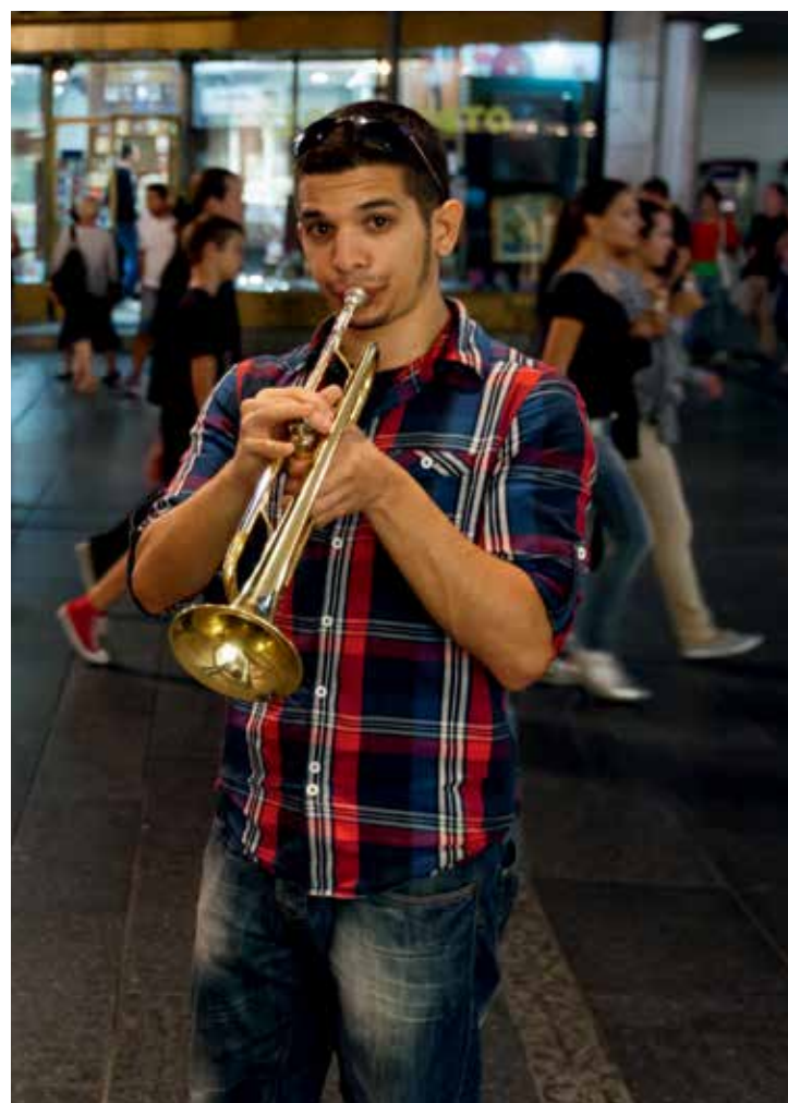
Млади музичар с тџубом у Кнез Михаиловој. Музиколози држе да је тџуба као симбол цеза за младе Београђане педесетих година ХХ века постојала популарна захваљујући њада културним филмовима.

Сџирани 20-21: Једно од џириџичких аџиракџија Калемеџдана је необична џрађевина Велики или Римски бунар. Посеџиоци се сџиралним сџеџеницама сџиџијају у бунар џридесетак метара. У ходницима џоред сџеџеница увек се чује сџирујање ваздуха, „џоџемни ехо Беоџрада“.