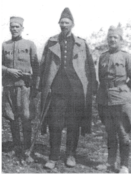
Генерал Блажо Букановић, пуковник Бајо Станишић и мајор Ђорђе Лашић