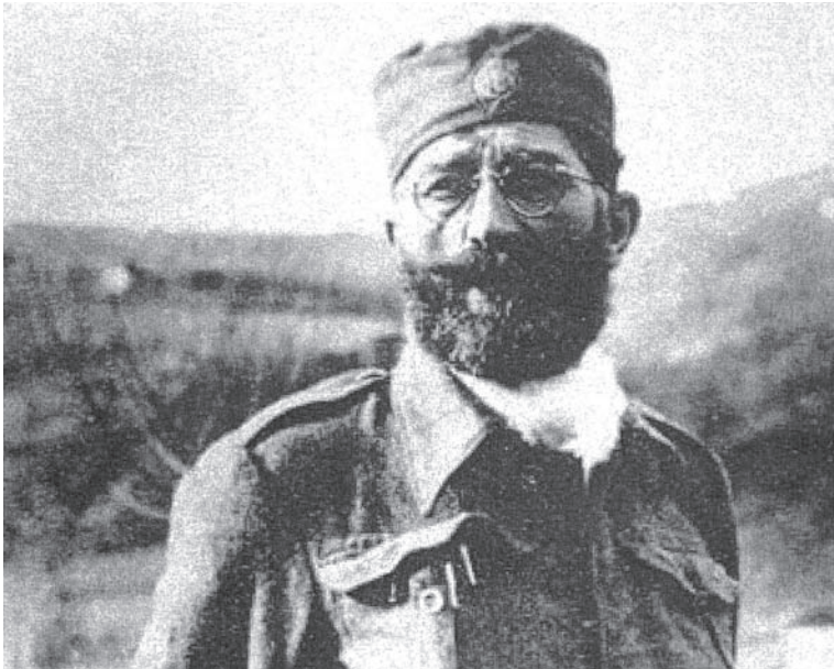
Легендарни ђенерал Драгољуб Дража Михаиловић и члан пишчеве заједнице „дједова“