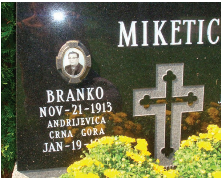
Споменик Бранку Микетићу у Канади (Торонто), где је умро и сахрањен 1987. године