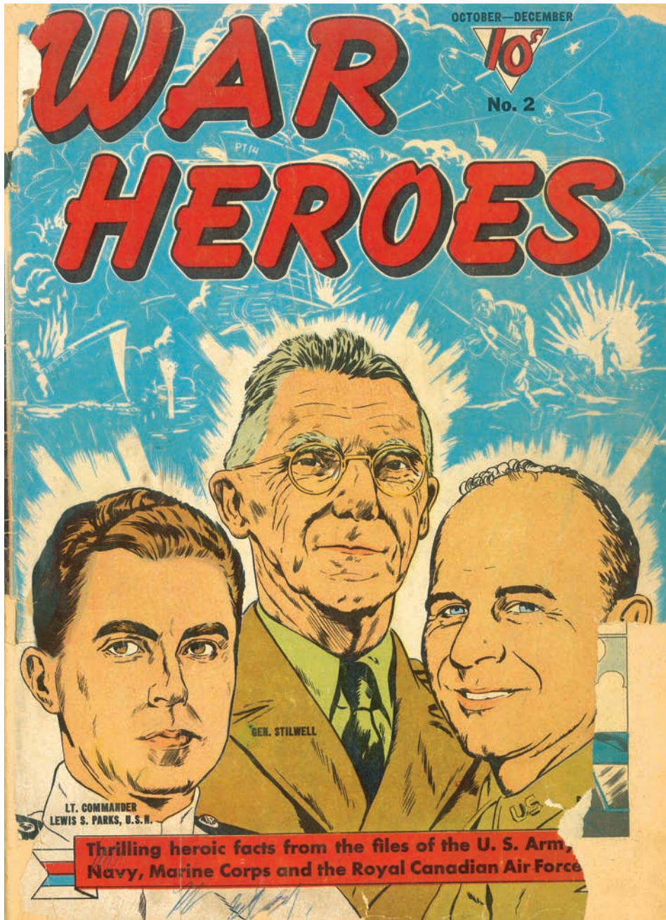
Насловна страна стрипа „Ратни хероји“ (октобар-децембар, 1942, број 2) у коме је објављена и сторија о генералу Дражи Михаиловићу