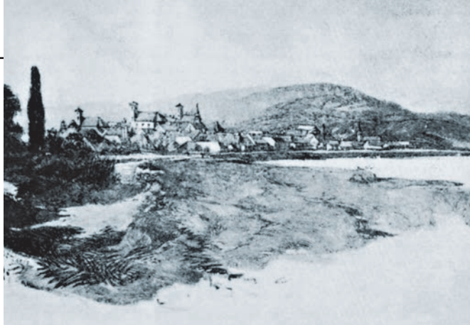
▲ Сенјандреја почетком XIX века

Живот Срба у Хабзбуршкој монархији, дуг више од два века, протичао је у прихватању европских норми, које су се затим преносиле и на Србе у Османском царству. Тиме је начин живота у тој хришћанској држави постао основа за модернизацију живота целокупног српског народа. Тај процес, обележен напуштањем оријенталних и прихватањем европских схватања, уобличен је већ у XVIII веку. Због тога проучавање живота у Хабзбуршкој монархији великим делом осветљава настанак данашњег начина живота.