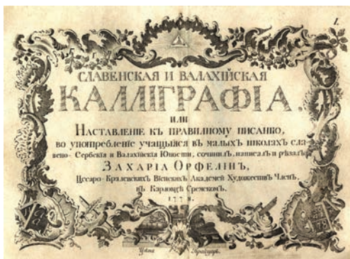
▲ Насловна страна Калиграфије Захарије Орфелина

Дух просветитељства и његове вредности у Србији на најбољи су начин у речи преточили водећи интелектуалци тог доба – Доситеј Обрадовић, Захарија Орфелин и Гаврил Стефановић Венцловић.