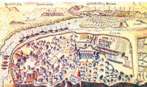
▲ Земун, гравира Филија Биндера, 1780

Међу Србима у Хабзбуршкој монархији уобличава се у то време модерно схватање појединца, породице, деце и породичног дома, настаје нов однос према хигијени, болести, лечењу и смрти, усваја се писменост и стиче навика читања, мења се однос према раду и одмору, васпитању и образовању, понашању и емоцијама.