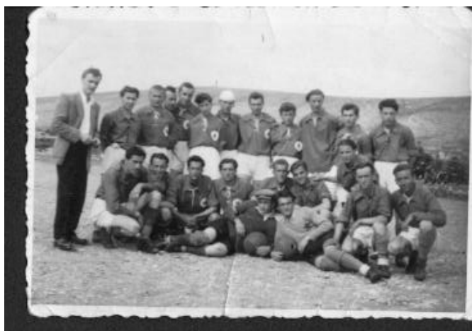
Пред утакмицу ФД „Миро Попара“ – ФД „Слога“ из Невесиња дана 23.IV 1948. године у Билећи (заједнички снимак)