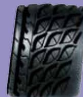
Гума за снег