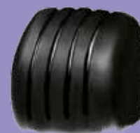
Гума формуле 1 за суво време