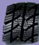
Гума за кишу

Шаре се бирају у зависности од тога куда се вози, и какве су временске прилике. Гуме за кишу треба да одводе воду, а гуме за снег треба да спрече да аутомобил проклиза.