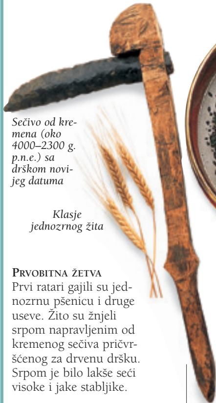
Sečivo od kremenca (oko 4000–2300 g. p.n.e.) sa drškom novijeg datuma