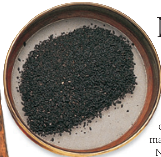
Ugljenisano seme pšenice, ječma i smokve i semenke grožđa sa arheološkog nalazišta u Jordanu

Obilato gajenje žitarica zahtevalo je efikasne načine obrade letine. Pšenica ili ječam su se prvo vrhli – tukli mlatilima kako bi se zrno odvojilo od ljuske. Žito se zatim vejalo – bacalo uvis kako bi vetar razvejavao ljuske dok je dragoceno zrnavlje padalo na zemlju.