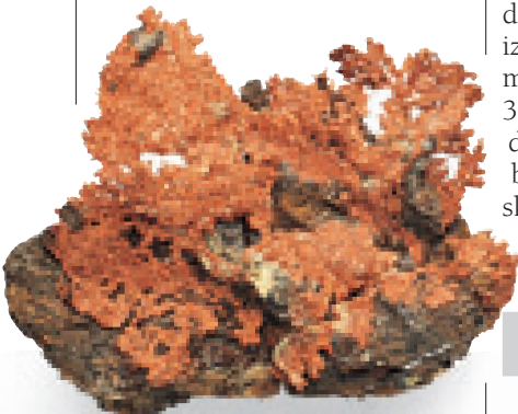
BAKAR Ovaj bakar je dovoljno čist da može da se koristi.

Ubrzo pošto su počeli da gaje useve, ljudi su napravili posebna oruđa za žetvu. Najstarije oruđe bilo je kratko, ravno sečivo pod imenom srp. Nastali oko 7000. g. p.n.e. i nadalje, srpovi od krekna bili su jedan od izuma koji je omogućio zemljoradnju (* vidi strane 12–13). Kasnije je nastalo zakrivljeno sečivo, koje može da seče nekoliko stabljika odjednom. Krivi srp se i danas ponegde upotrebljava, ali je kameno sečivo zamenjeno čeličnim.