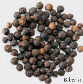
Biber u zrnu

Trgovina začинима poput cimeta, karanfilića i bibera datira još od 2000. g. p.n.e. ili ranije. Začini su poreklom sa Istoka i trgovci koji su znali gde da ih nađu su dobro zarađivali tako što bi ih donosili na Zapad. Trgovci su svoje izvore – mesta poput Ostrva začina (danas deo Molučkih ostrva u Indoneziji) – čuvali u strogoj tajnosti.