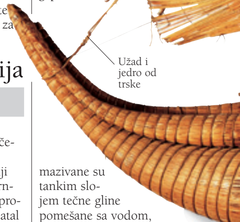
Užad i jedro od trske

ČAMAC Ovaj čamac sa jezera Titikaka u planinama Anda napravljen je od trske. Egipćani su pravili brodove od trske već oko 4000. g. p.n.e.