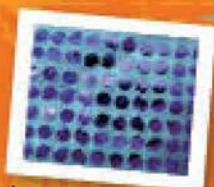
Materijal sa šljokicama