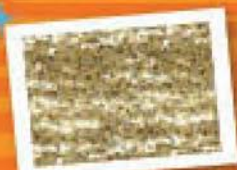
Materijal sa sitnim šljokicama