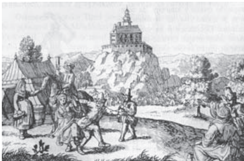
Оштри Камен, дворца Павла Бакића

јаничарској побуни против Ибрахима, великог везира Отоманске империје. Када је побуна угушена, а Ибрахим се учврстио у султановој милости, Павле Бакић је добио огорченог непријатеља на највишем месту у Турској. Ибрахим је војводу Бакића оптужио да је издајник и да је задржао новац и сребро Ферхат-паше које је било конфисковано. Припремајући у јесен 1525. године свој одлазак из Турске, Павле Бакић је склопио троја кола драгоцености. У то време уживао је највеће поверење и поштовање угарског краљевског двора и био први међу Србима када се радило о борби против Турака. Посебно га је уважавао командант угарских војних снага према Турској, Пал Томори. Као командант Доњих крајева, Томори је био вишеструко повезан са Србима, који су насељавали граничне области, главно поприште борби против Османлија и веома се трудио да они буду уз њега. Из српских крајева регрутовао је знатан део својих ратника, посебно оних који су се борили на бродовима, шајкашима. Уживао је велико повере-