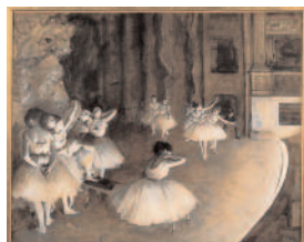
Detalj sa slike Proba baleta na pozornici , Edgar Dega, 1874, pojavljuje se na strani broj 26. Ulje na platnu, 65 x 85 cm.