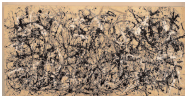
Detalj sa slike Jesenji ritam # 30 Džeksona Poloka pojavljuje se na strani broj 29. The Metropolitan Museum of Art, George A. Hearn Fund, 1957. (57.92)