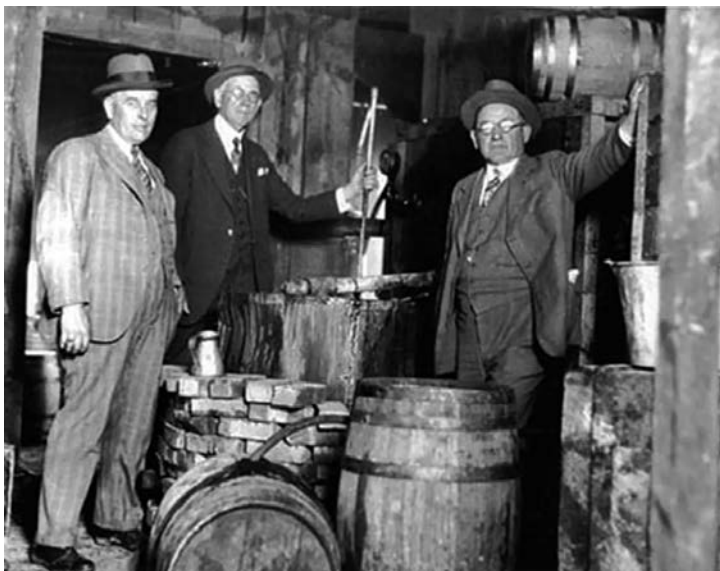
PROHIBICIJA: Izvor prihoda koji se nije mogao zaobići

nisu dovoljno dugo živeli da to shvate. Novi „bosovi“ nisu dozvoljavali da im neko uznemirava proizvođače, i vrlo brzo je klasični reket bespomoćnih malih biznismena prestao da postoji. Crna ruka više nikog nije plašila, a reket će se ponovo pojaviti pedesetih godina, ali u krajnje rafiniranoj varijanti.