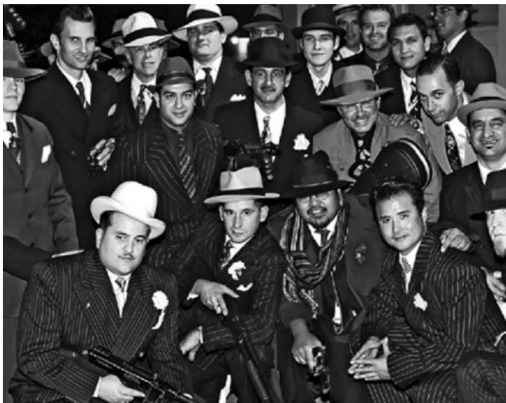
KRIMINAL KAO NAČIN ŽIVOTA: „Vojnici“, „poručnici“ i „kapetani“

tumačenja i primene nema nikakve dileme. Nema opravdanja za greške, potkradanje porodice, „poslove sa strane“ za koje porodica ne zna, ugrožavanje sigurnosti porodice na bilo koji način, da ne govorimo o saradnji sa zakonom. Kazna je uvek smrt, sprovodi se iznenada tako da grešnik nema šanse da se izvuče i to služi kao primer ostalima, uz jasan stav da je reč o „nečasnoj“ delatnosti člana koji je uprljao ne samo svoj obraz već i ugled cele porodice.