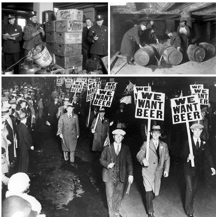
PROHIBICIJA: Plodno tlo za korene organizovanog kriminala

na njihovu teritoriju, morale su da traže saglasnost. Ako neka mafijaška organizacija želi da likvidira neposlušnog člana koji je pobjegao na teritoriju druge mafijaške organizacije, onda ga neće lično proganjati, jer bi to bilo ozbiljno kršenje teritorijalnih prava druge organizacije. Umesto toga zamoliće tu organizaciju da ubije člana koji je osuđen na smrt i koji se nalazi sada na teritoriji organizacije zamoljene da izvrši kaznu. Ona ima obavezu da taj zahtev izvrši, bez posebnog plaćanja ili zahvaljivanja, jer će jednog dana ona biti u situaciji da takvu uslugu traži od druge organizacije.