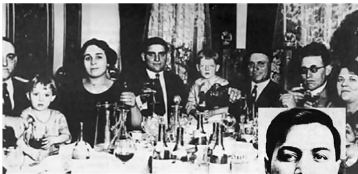
Braća Đena na porodičnom skupu

Italijanske zajednice širom Amerike preko noći su organizovale proizvodnju alkoholnih pića za mafijaše koji su ih dalje distribuirali. To je bio odnos proizvođača i naručioca, a naručilac je dobro plaćao za proizvedeno piće. U toj varijanti neki iznuđivači koji nisu shvatili da su se vreme i igra promenili pokušali su da reketiraju ovaj novi biznis. Za većinu njih bila je to najveća greška njihovog života, ali