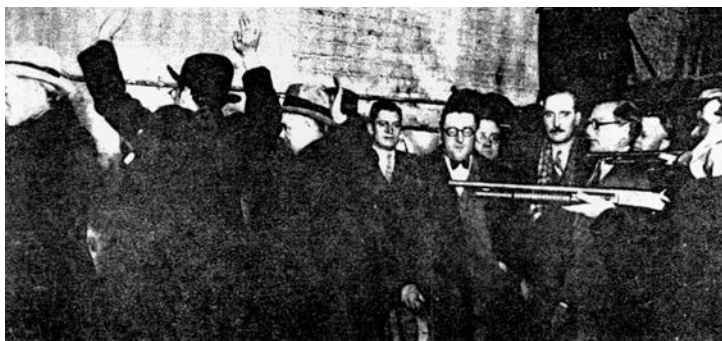
FILMSKA SCENA: Američka mafija

Struktura mafije kao društva kriminalaca bitno se razlikuje na Siciliji, ili u Italiji, od one u Americi, što je i logično budući da se prilike u ove dve zemlje razlikuju kao nebo i zemlja, po svim pitanjima. Na Siciliji, starim mafijašima je bila važnija „čast“ od novca, važnije su bile stare vendete nego posao. Kod mafijaša u Americi, pogotovo onih koji su tamo rođeni, novac je bio krajnji i jedini cilj. Stari mafijaši, koji su u drugoj polovini 19. veka, sa doseljnjem u Ameriku, doneli i strukturu organizacije iz starog kraja, i bili posprдно nazivani „onima koji suču brkove“, i koje je sa scene počistio Laki Lučano likvidiravši stare, velike mafijaše Džoa Maseriju zvanog Šef i Salvatorea Marancana, držali su se „etničkog kriminala“, tražeći žrtve među svojim zemljacima, kao da su još uvek na Siciliji, dok su američki mafijaši izašli iz okvira etničkog kriminala, izašli iz geta i razvili kriminalne aktivnosti