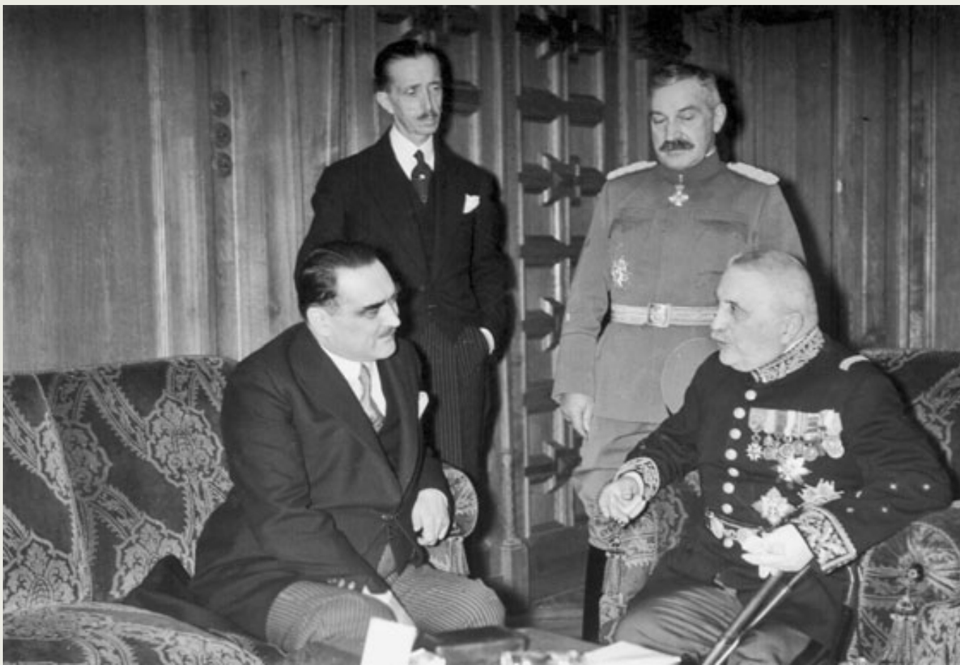
U prvom planu: Stojadinović i D'Epere U drugom planu: Nj.E. R. de Dampjer, general Čolak-Antić