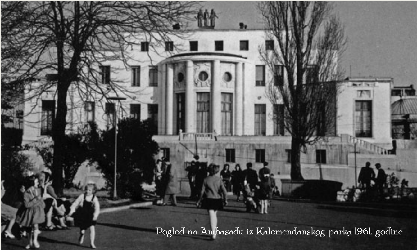
Pogled na Ambasadu iz Kalemegdanškog parka 1961. godine

J edanaestog novembra 1918. završen je Prvi svetski rat, mir se vraća na Stari kontinent. Francuska i Srbija su izvojevale pobjedu zajedno sa svojim saveznicima. Konačno je, na osnovu mirovnih sporazuma, stvorena Kraljevina Srba, Hrvata i Slovenaca. Njena prestonica je Beograd. Upravo u tom trenutku Francuska, kuma mlade države, odlučuje da sagradi ambasadu koja će slaviti snagu našeg savezništva, kao što, nedaleko odatle, u srcu