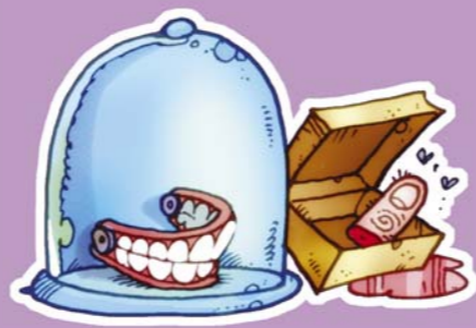
Bonus poeni – mošti davnih predaka

A evo i poteza koji se zbog žaoke skrivene između redova nalaze na ivici isključenja, ali se obično kažnjavaju samo kartonima odgovarajuće boje, slično kao u fudbalu: