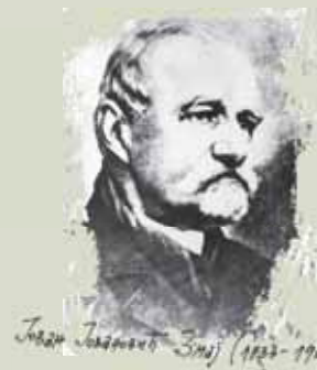
Јован Јовановић Змај (1873-1904)

Ала је леи Овај свеи - Онде ѿиок, Овде свеи; Тамо њива, Овде сад; Ено сунца, Ево хлад; Тамо Дунав Златиа ѿун, Онде ѿрава, Овде жбун. Славуј ѿева, Не знам ѿди - Овде срце, Овде ѿи!