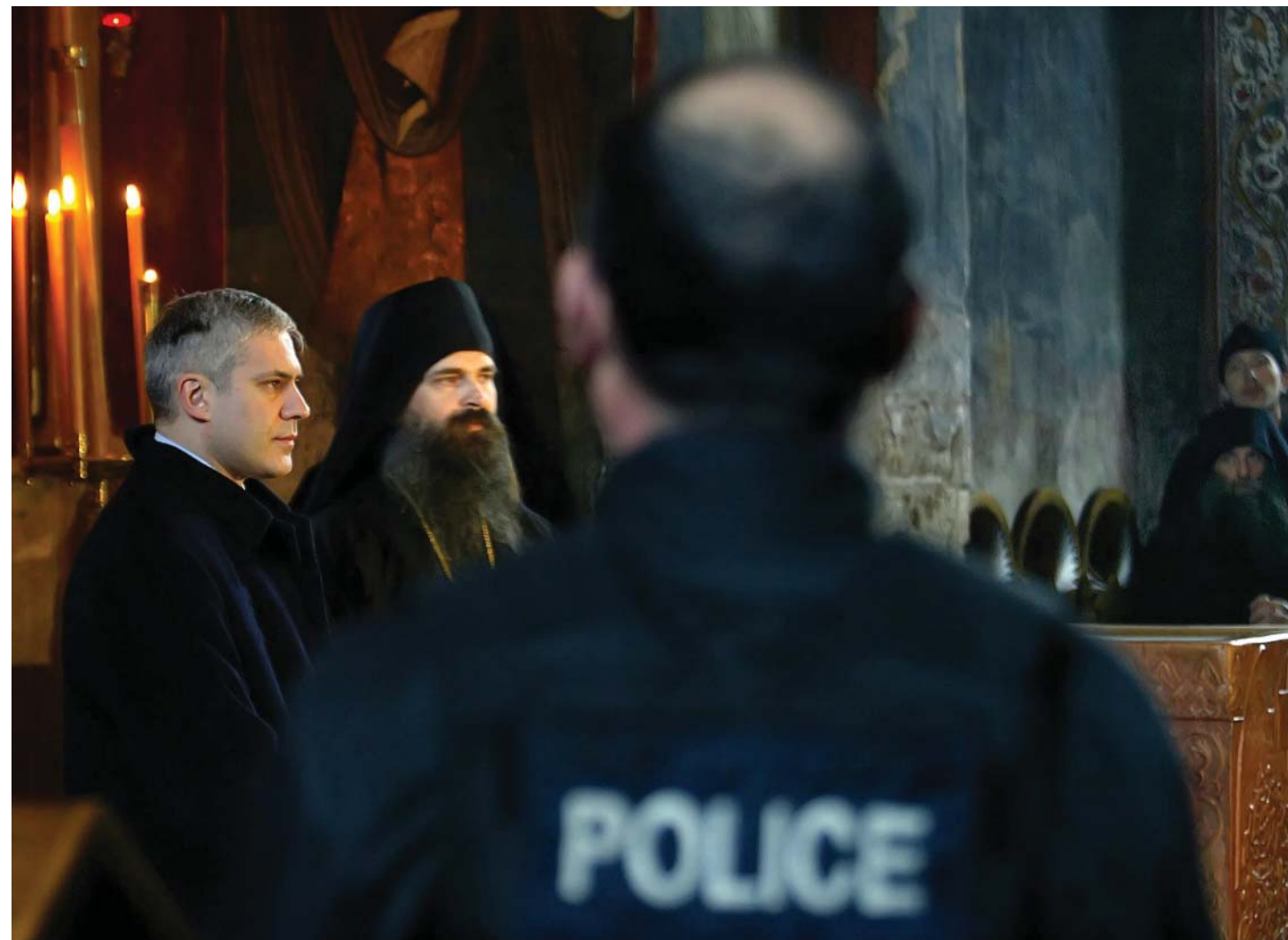
Tadić na Kosovu