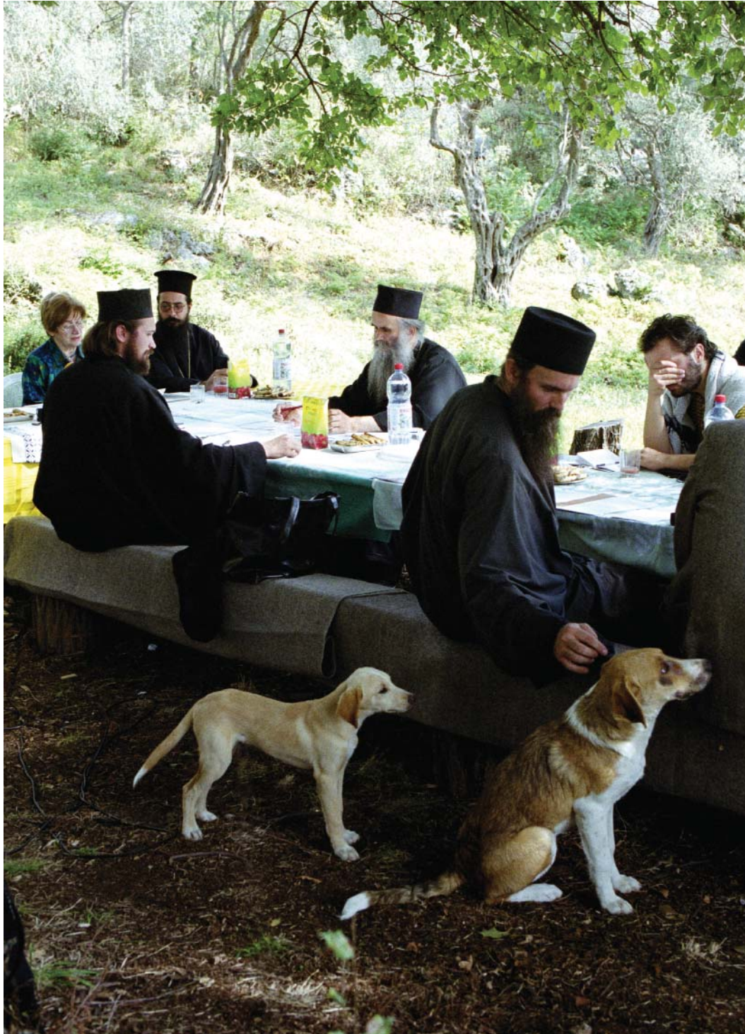
vladika Amfilohije u manastiru Vranjina