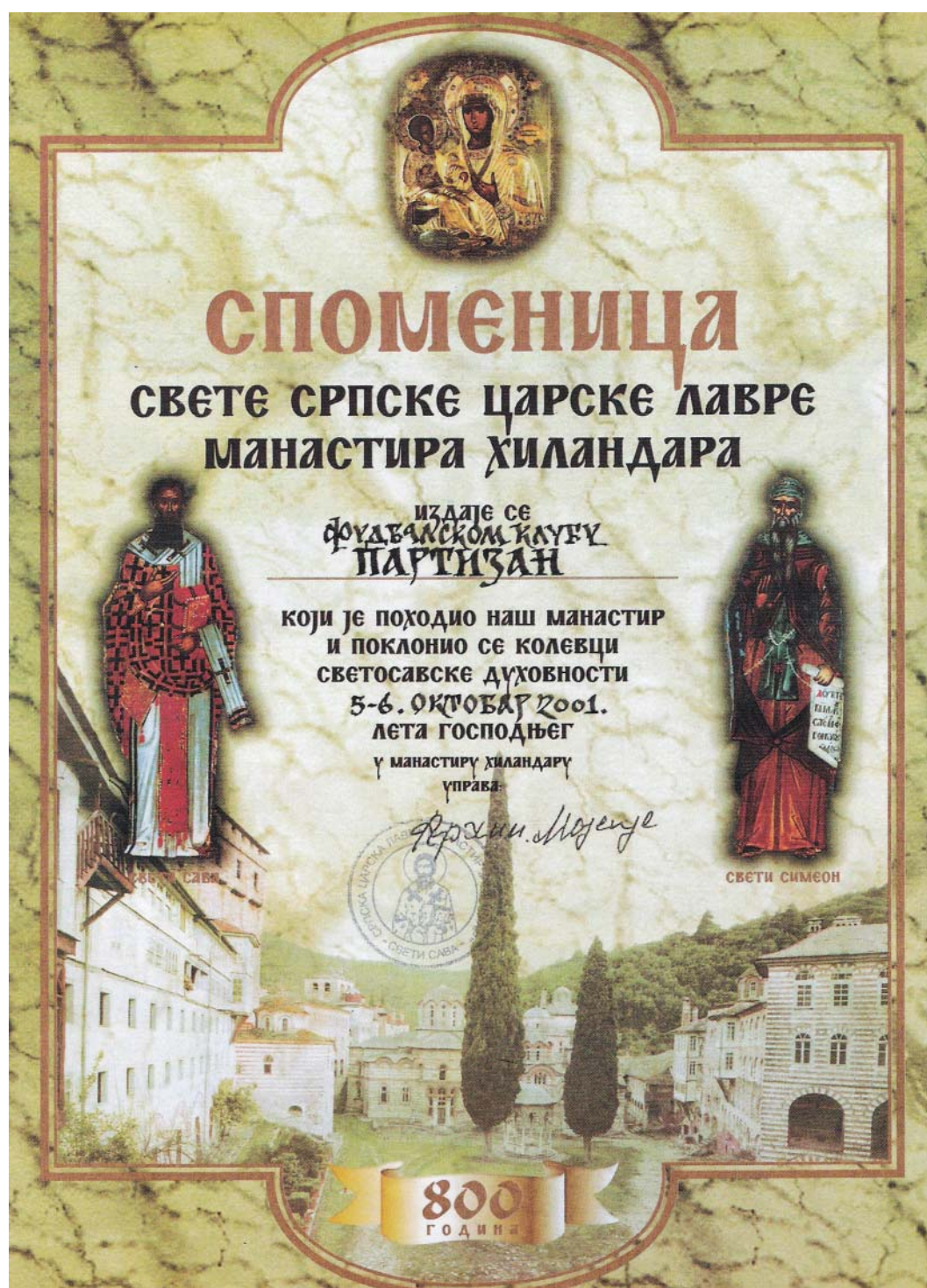
hilandarska spomenica fudbalerima Partizana