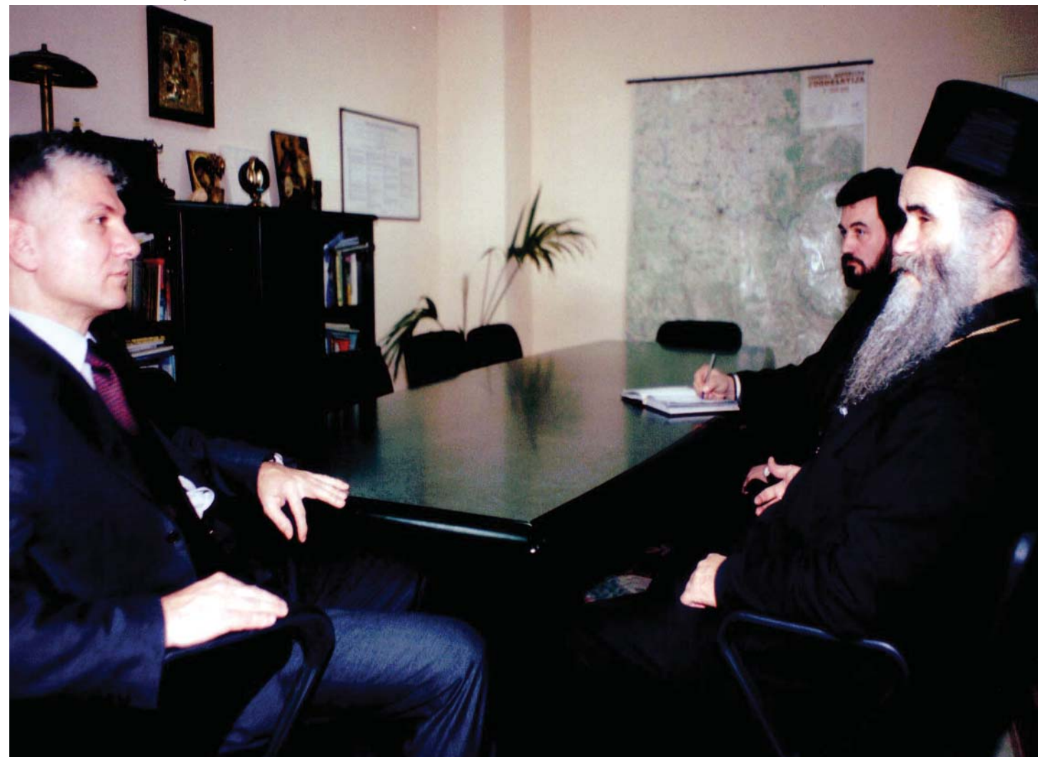
Đinđić i vladika Amfilohije