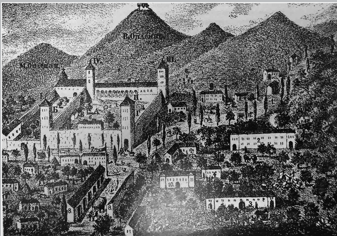
Карађорђево градоу Тополи, Музеј града Београда