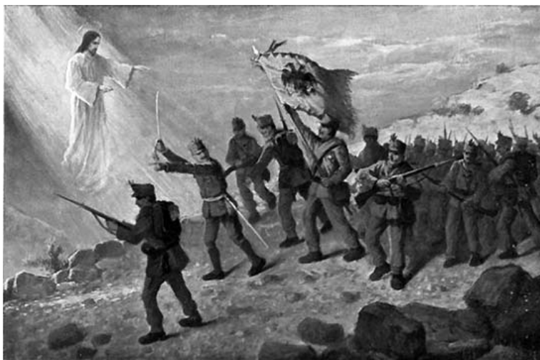
Ратна дописница „Gott mit uns“