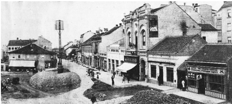
Београдски Зелени Венац.